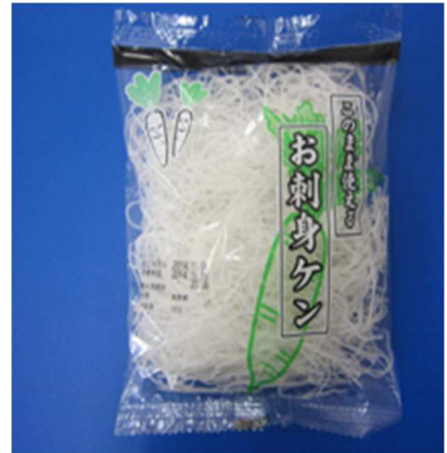
商品例(刺身のつま)