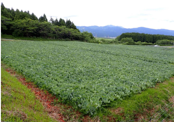
キャベツ生産を開始したほ場

農地の貸借は農地バンク事業で令和6年1月より1.7haの農地貸借が開始されました。同社は今後、静岡県内で130haの農地の確保を検討しております。